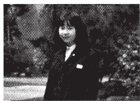
13세인 메구미씨는 중학교 하교 도중에 납치당하였다

2002년에 일본의 고이즈미 수상이 북한을 방문했을 때 그 때까지 지지기를 떼고 있었던 북한 당국이 마침내 일본인 납치를 인정했습니다. 그러나 이것은 해결을 향한 여정의 겨우 한 걸음에 지나지 않습니다.